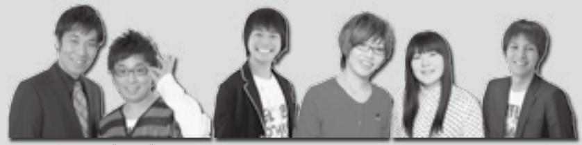
パンクブーブー 中山功太 少年少女 ユウト

今年のシグナス祭一大イベントは、吉本興業の芸人四組を招いてのお笑いライブです！ 個性豊かなキャラのボケ、戸惑い気味のツッコミの漫才で2009年のM-1グランプリで優勝を果たしたパンクブーブー。時報の音に合わせたネタで2009年R-1グランプリ優勝を果たした中山功太。動きは少なく、淡々とした口調でコントを行う少年少女。ユウトを招いてのお笑いライブになります。